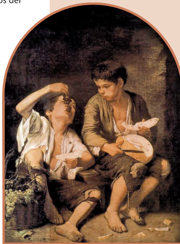
▲ Bartolomé Esteban Murillo: Niños comiendo uvas y melón , 1645-1650. Esta pintura refleja la vida de los niños mendigos en Sevilla, una de las ciudades más importantes y ricas de España, pero que también tenía altos índices de pobreza.

En la visión del mundo y en la actitud cultural del sentimiento de crisis se refleja el concepto de desengaño , muy importante. Es notable la frecuencia de los motivos del desengaño y la vanidad de la vida, la conciencia de la fugacidad y la fragilidad, la impalpable separación entre la realidad y la apariencia, el escepticismo fundado en lo vano de la existencia humana de este mundo. Se repite el tema de la muerte y del tiempo destructor. Esto explica también la inclinación religiosa y filosófica de los muchos textos del siglo, que se