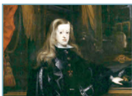
Juan Carreño de Miranda: Carlos II de España , 1675.