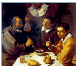
Diego Velázquez: Comida de pícaros , 1618.