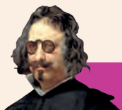
Francisco de Quevedo (1580-1645)

Escritor perteneciente al Siglo de Oro español, considerado uno de los poetas más destacados de la lírica española. Tuvo una intensa vida asociada con las actividades de la corte. La temática principal de su obra fue la desilusión y la melancolía frente al tiempo y la muerte.