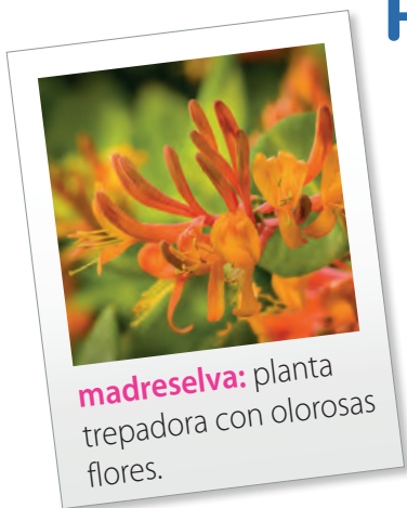
madreselva: planta trepadora con olorosas flores.

Pedazo de alma fragante de los peumos de mi tierra, que parecías un huaso llevando manta chilena, al son de tu propia música —bordoneo de vihuela — cuando te hallabas cucarro sabías bailar la cueca.