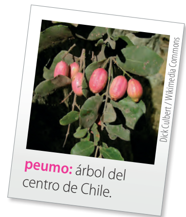
peumo: árbol del centro de Chile.

¿Cómo se veía el trompo? ¿Se parece a alguno que hayas visto?