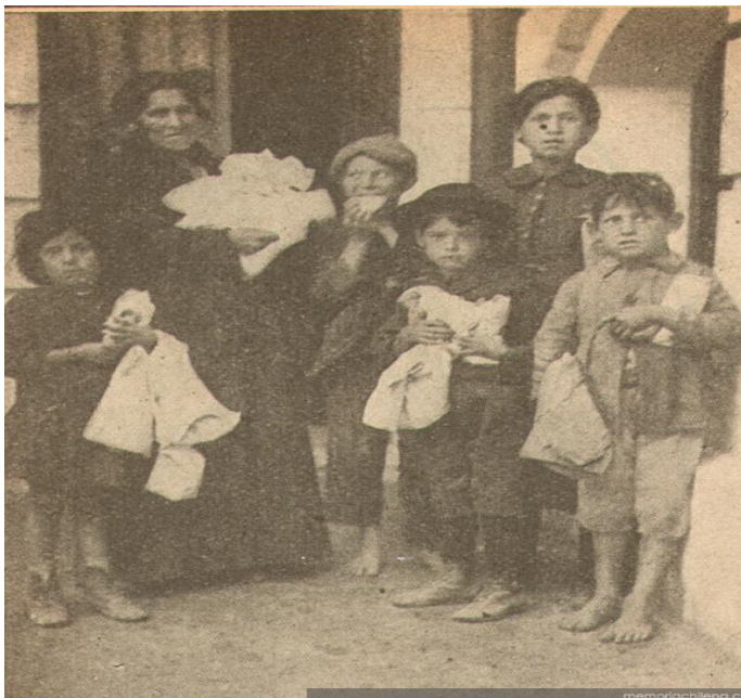
Pobres en Valparaíso, 1919