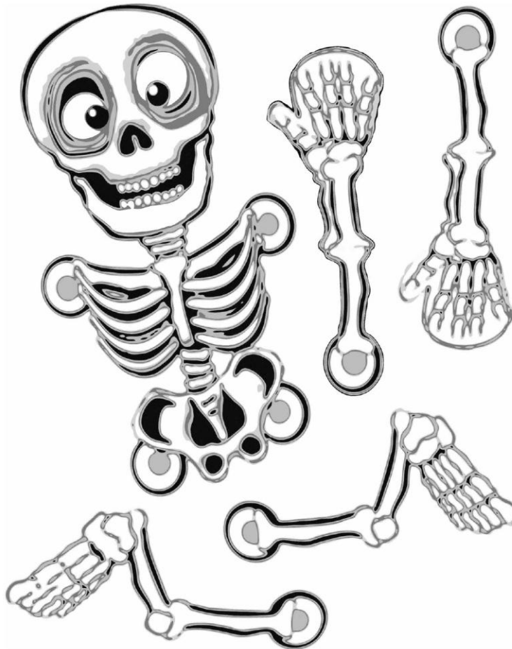
Esqueleto (para recortar)