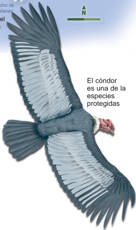
El cóndor es una de las especies protegidas

En la zona norte del país viven muchos y diversos animales entre mamíferos y aves autóctonas, diferentes a las especies originarias de La Pampa y de las regiones andinas, donde habitan la llama, el guanaco, la vicuña, la alpaca y el cóndor. Solamente cerca de la mitad de los distintos ecosistemas que se conocen de Argentina están protegidos, lo que representa más del 4% de la superficie total. Además, la UNESCO (Organización de las Naciones Unidas para la Educación, la Ciencia y la Cultura) ha establecido cinco reservas de la biosfera dentro de su territorio.