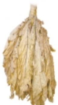
Hojas de tabaco

La actividad económica de estas islas destaca por la presencia de minerales (bauxita en Jamaica), turismo y de la agricultura de plantación, con cultivos tropicales como la caña de azúcar (principal cultivo de exportación en Cuba), plátanos, café, cítricos, cacao, caucho o tabaco. El papel de la industria se encuentra muy poco desarrollado y solamente predomina en Puerto Rico y en el sector manufacturero (alimentario y textil) y del cemento (R. Dominicana).