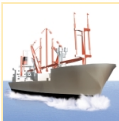
El transporte marítimo ayuda a la economía de las islas

La Habana representa la mayor ciudad de todas las Antillas (con algo más de unos dos millones de habitantes) y constituye el principal puerto marítimo y centro económico de Cuba, un país que concentra su población en las capitales de provincia. Dentro de las Bahamas (un conjunto de unas 700 islas en el que la mayoría de los ciudadanos vive únicamente en dos de ellas) el papel como plaza financiera y sede de empresas supone una actividad crucial para su economía.