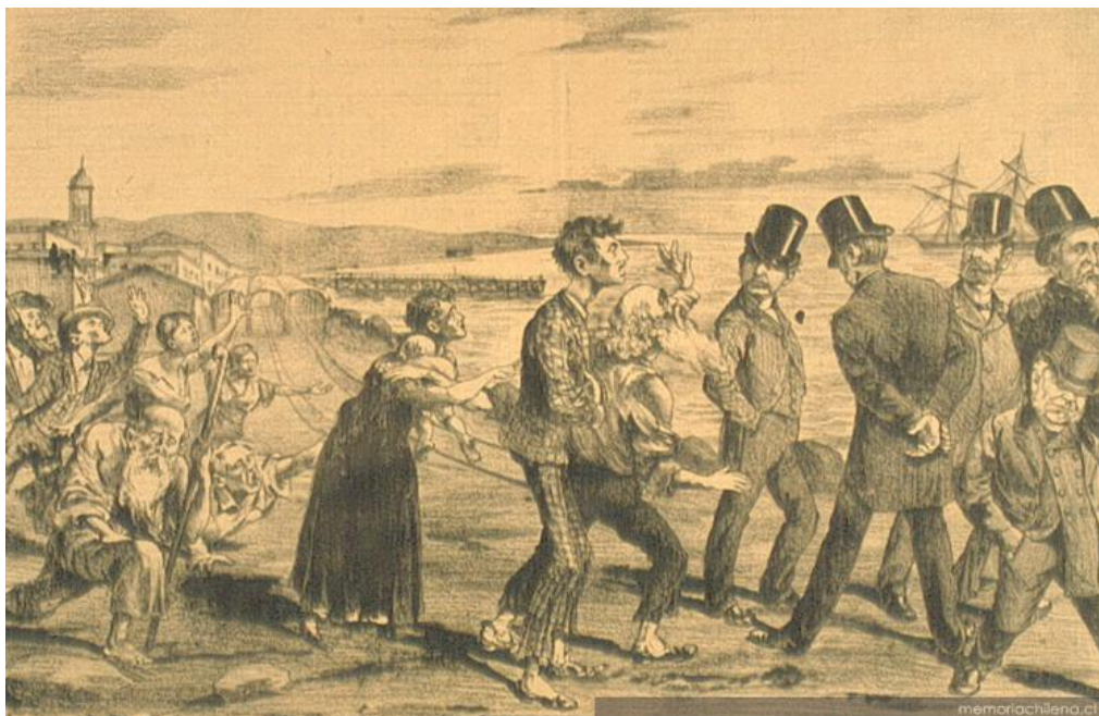
El hambre en Iquique. El Recluta . Santiago: Impr. de El Recluta, 1891.