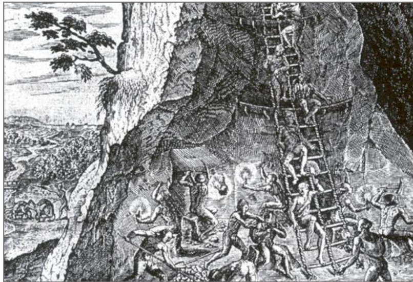
Indígenas trabajando en las minas de Potosí.