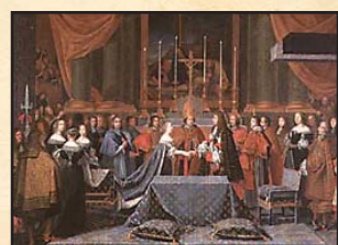
Primera boda de Luis XIV

● 1667: Se inicia la Guerra de Devolución.