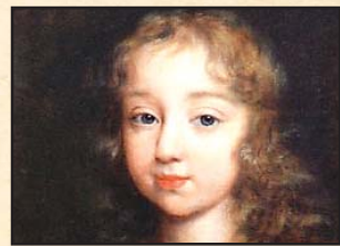
Luis XIV a los ocho años

● 1638: Luis XIV nace en la población de Saint-Germain-en-Laye, en el departamento de Yvelines.