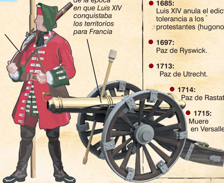
Cañón francés de la época en que Luis XIV conquistaba los territorios para Francia