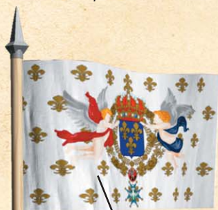
Bandera estandarte que Luis XIV usaba en sus campañas